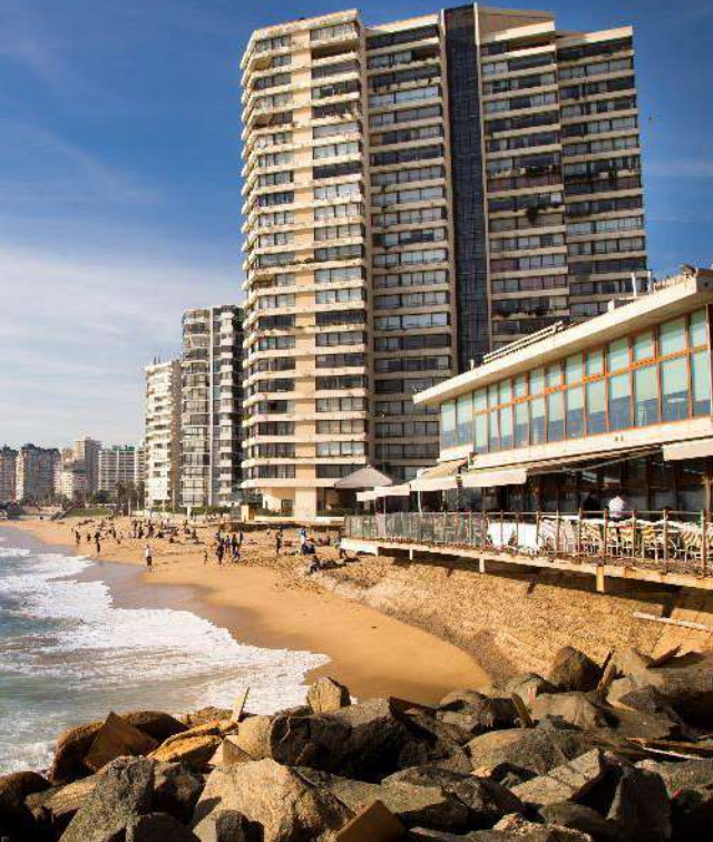
Viña del Mar, Chile