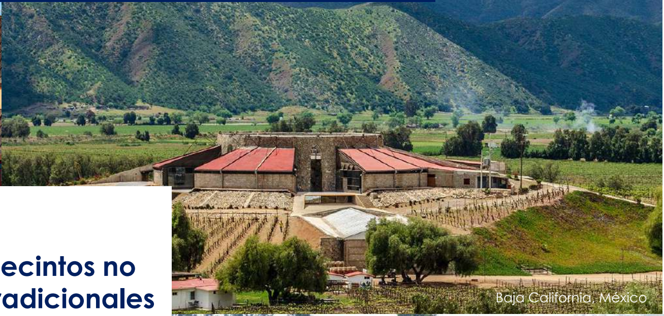
Baja California, México

Más de 420 Recintos no tradicionales en 73 ciudades