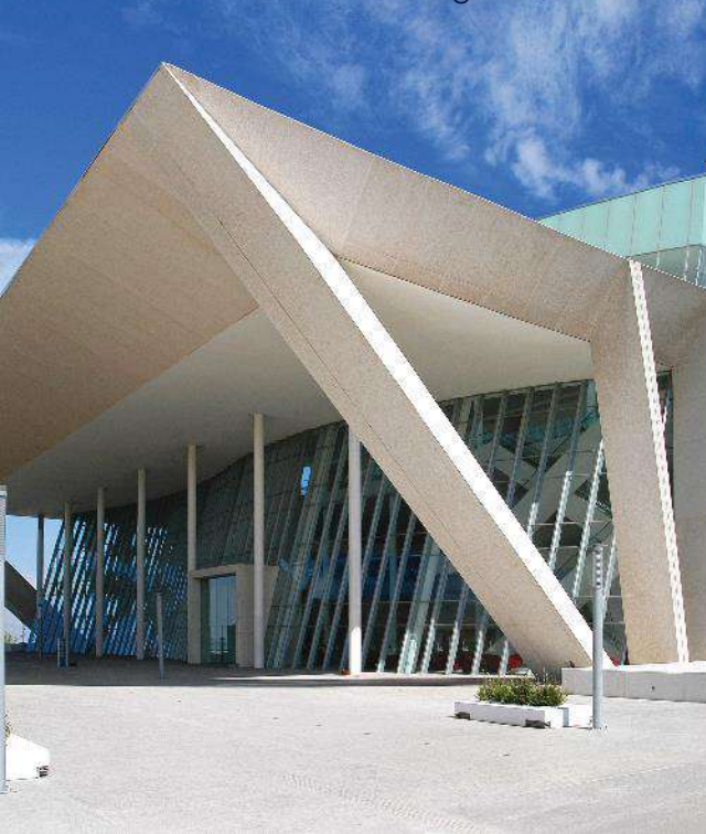
Querétaro Centro de Congresos, México