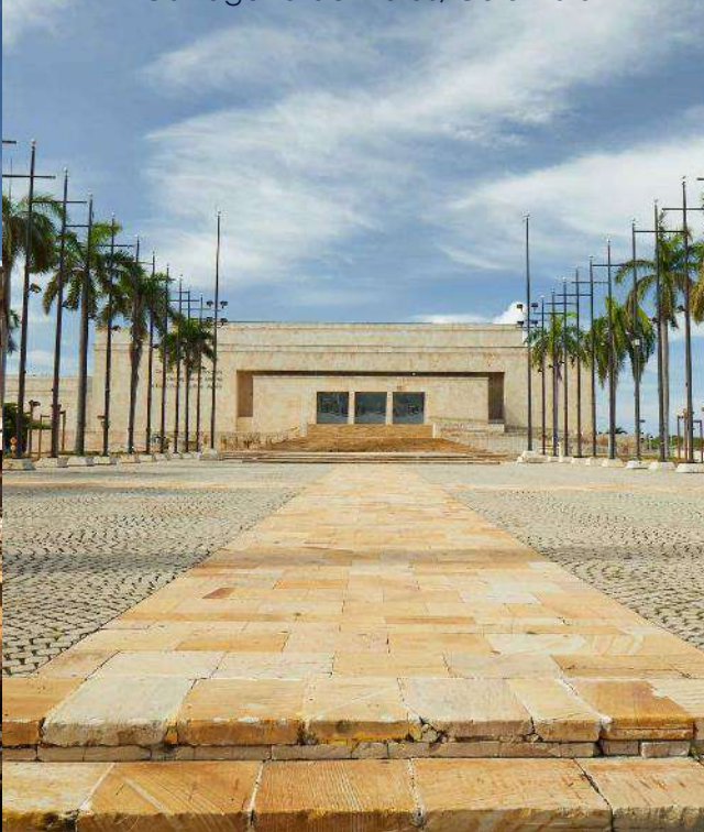
Cartagena de Indias, Colombia