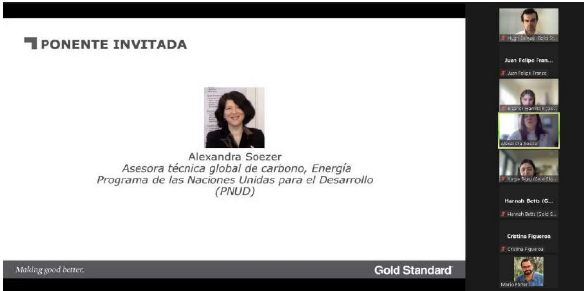
Imagen: conversación con ponente invitada.