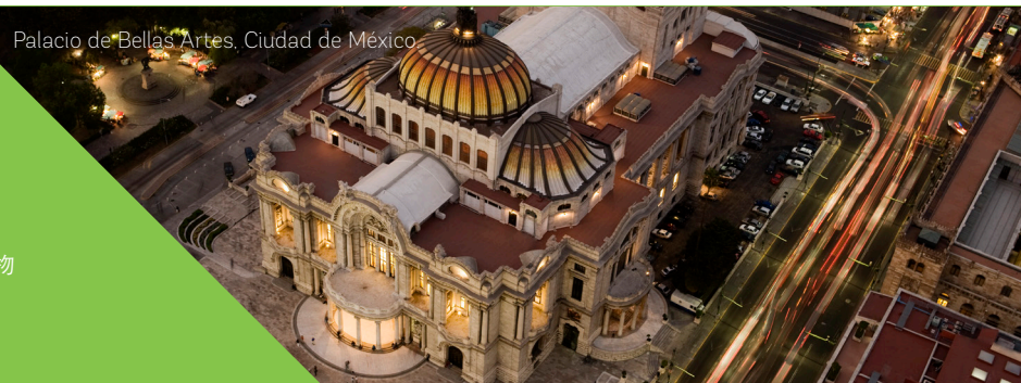
Palacio de Bellas Artes, Ciudad de México