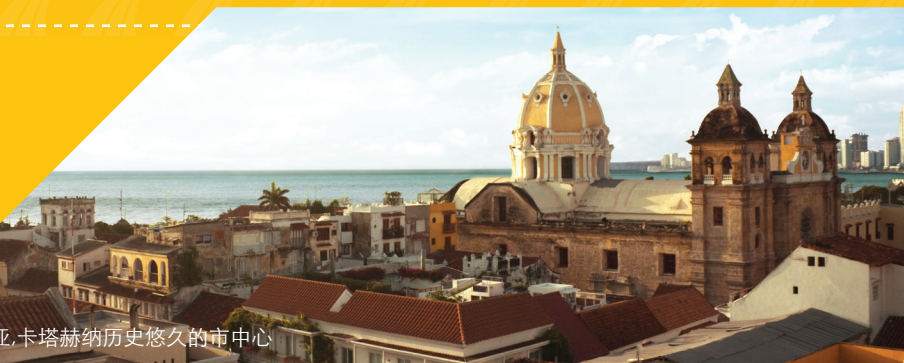
哥伦比亚,卡塔赫纳历史悠久的市中心