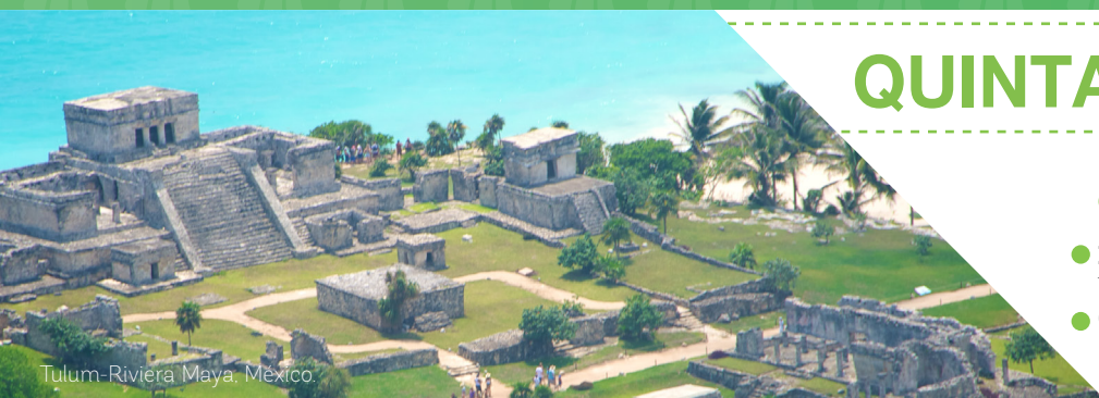
Tulum-Riviera Maya, México.