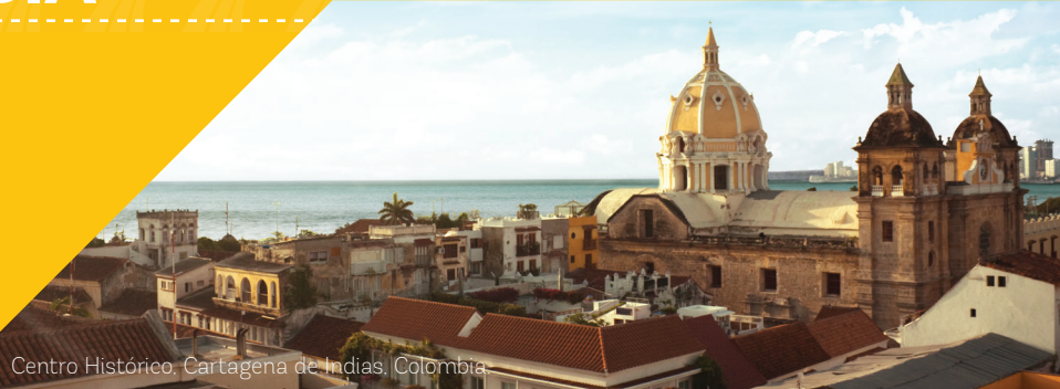
Centro Histórico, Cartagena de Indias, Colombia.